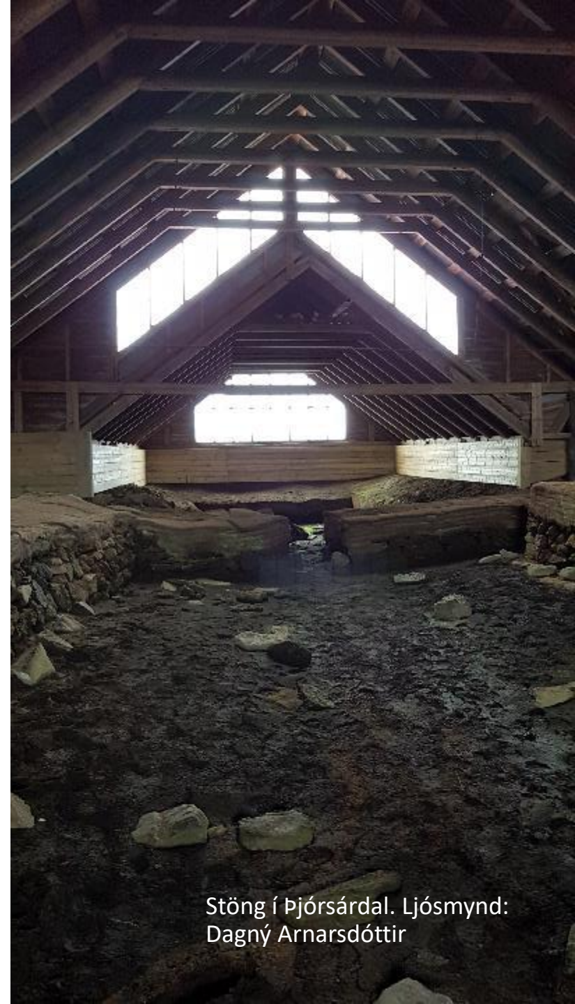
Stöng í Þjórsárdal.